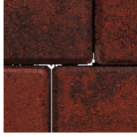
Rood zwart genuanceerd